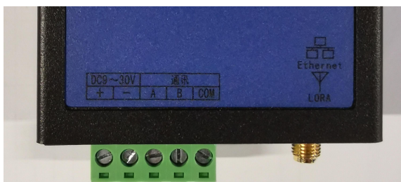
图 3 AF-GSM300/400 接口