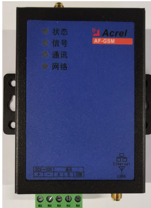
图 1 AF-GSM300/400

本产品提供标准 RS485 数据接口，可以方便的连接 RTU、PLC、工控机等设备，仅需一次性完成初始化配置，就可以完成对 MODBUS 设备的数据采集，并且与安科瑞服务器进行通讯，设备外形如图 1 所示。